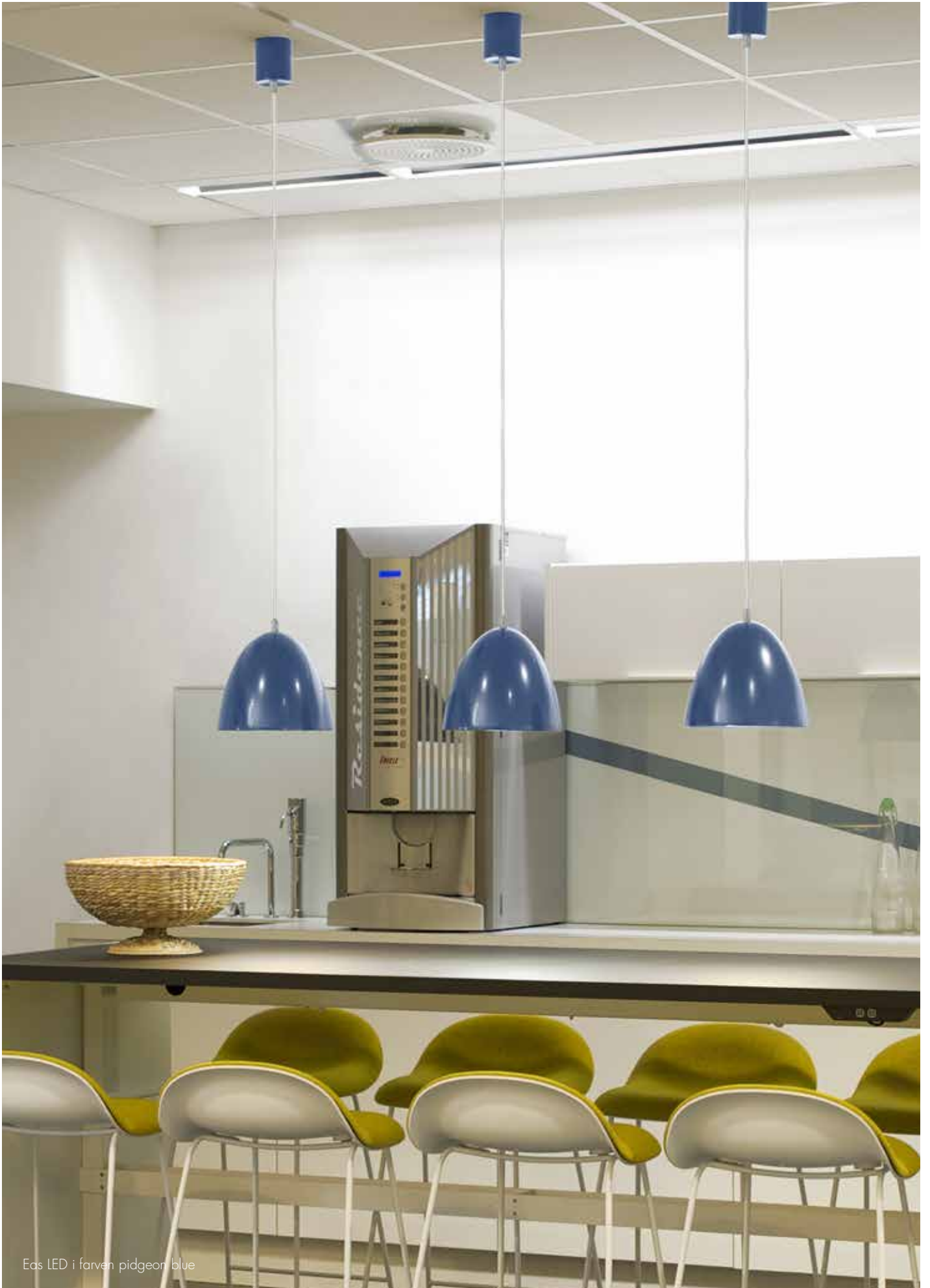
Eas LED i farven pigeon blue