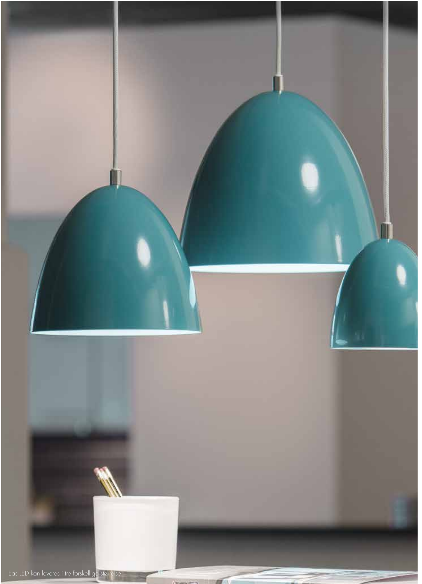
Eas LED kan leveres i tre forskellige størrelse