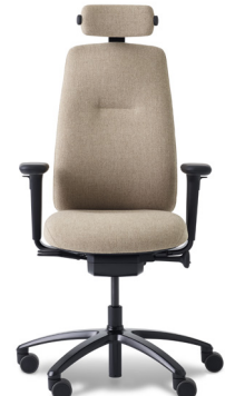
RH LOGIC 220 ELITE

200 mm ekstra polstring i sæde- og rygpude