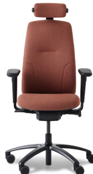
RH LOGIC 220

200 mm ekstra polstring i sæde- og rygpude