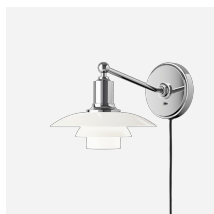
PH 2/1 Væg