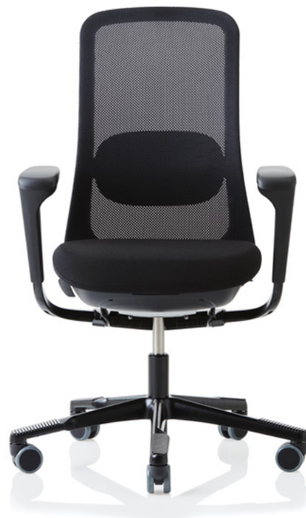
Design: Frost Produkt AS, Powerdesign AS og Flokk Design Team Patent- og designbeskyttet