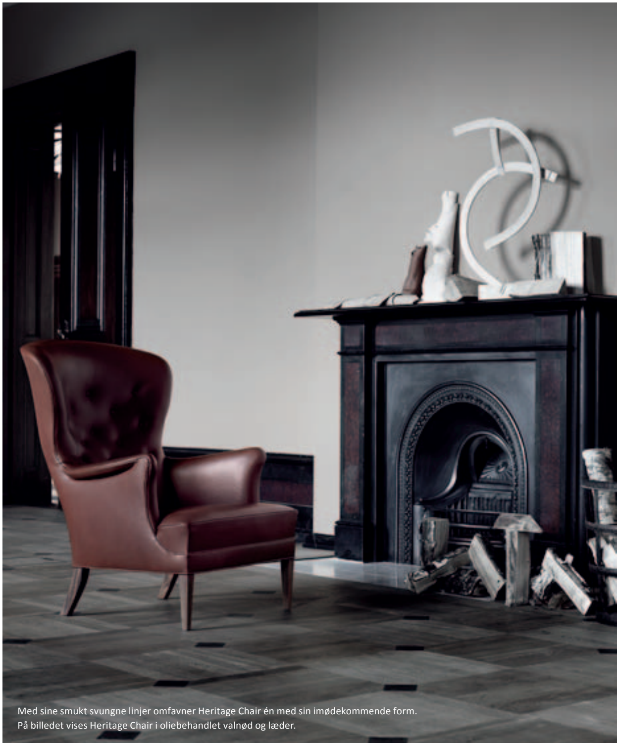
Med sine smukt svungne linjer omfavner Heritage Chair én med sin imødekomende form. På billedet vises Heritage Chair i oliebehandlet valnød og læder.