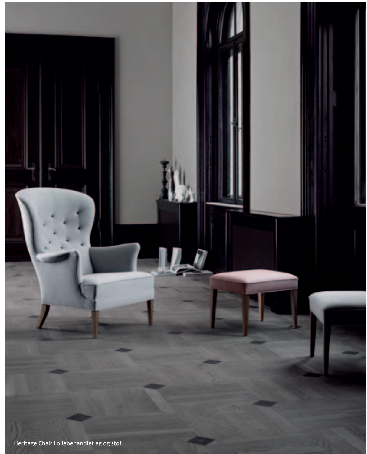
Heritage Chair i oliebehandlet eg og stof.