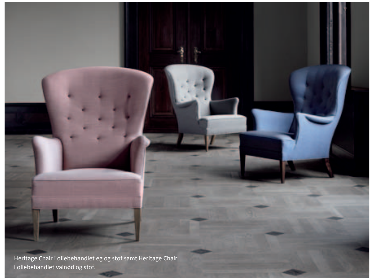
Heritage Chair i oliebehandlet eg og stof samt Heritage Chair i oliebehandlet valnød og stof.